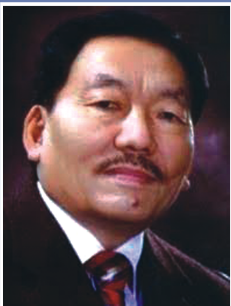
श्री पवन चामलिङ सम्माननीय अध्यक्ष

शुभ जन्म दिवसको पावन अवसरमा हार्दिक मङ्गलमय शुभकामना अर्पण गर्दछौं।